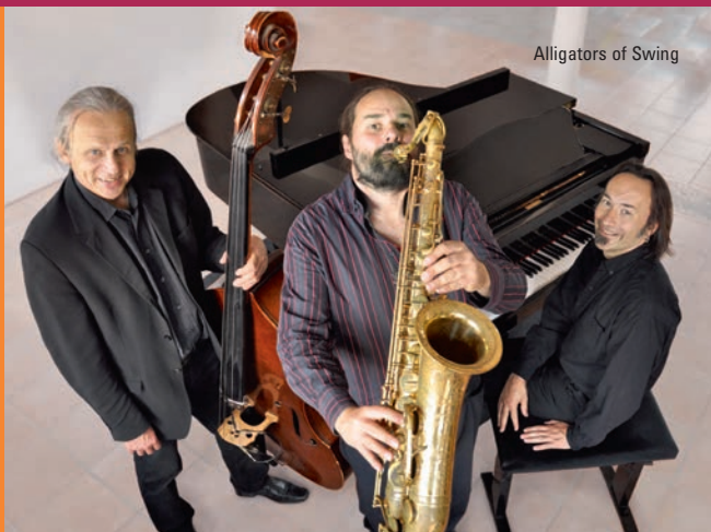
Alligators of Swing